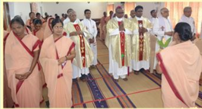
Feast Mass, St. Anne's Provincialate : Kmu