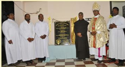
Blessing of the New Rectory : Valangaiman