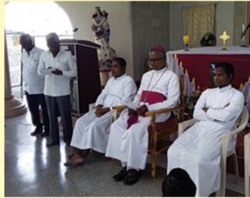
Pastoral Visit : Thirumanthurai