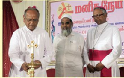
Meeting Arranged by the Commission for Dialogue : Kmu