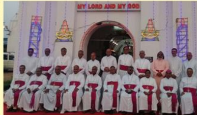
TNBC Half - Yearly Meeting : Chenglepet

Bishop's House, Post Box No. 3, Kumbakonam - 612 001.