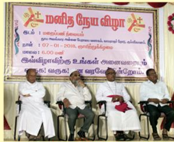
Meeting Arranged by the Commission for Dialogue : Kmu